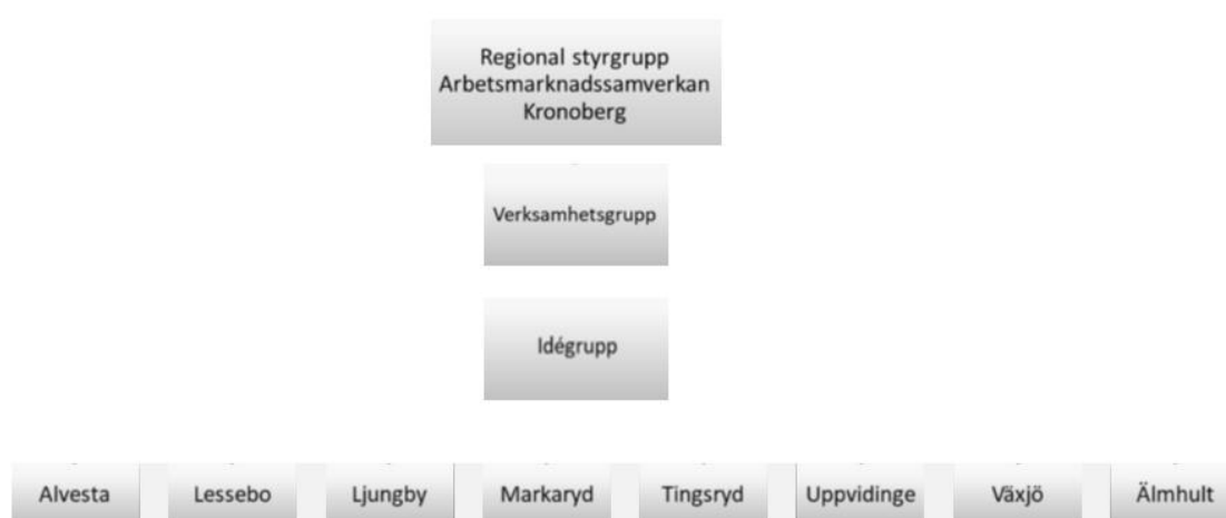
Figur 2. Lokal och regional samverkansstruktur för DUA

Samverkansgrupperna har syftet att stärka samverkan i respektive kommun. Representation avgörs av respektive kommuns lokala behov, och kan exempelvis bestå av representanter från samverkansparterna lokalt, vuxenutbildning, näringslivskontor, civilsamhälle med mera. Den lokala samverkansgruppen ska vara ett stöd för att implementera beslutade projekt och verksamheter lokalt.